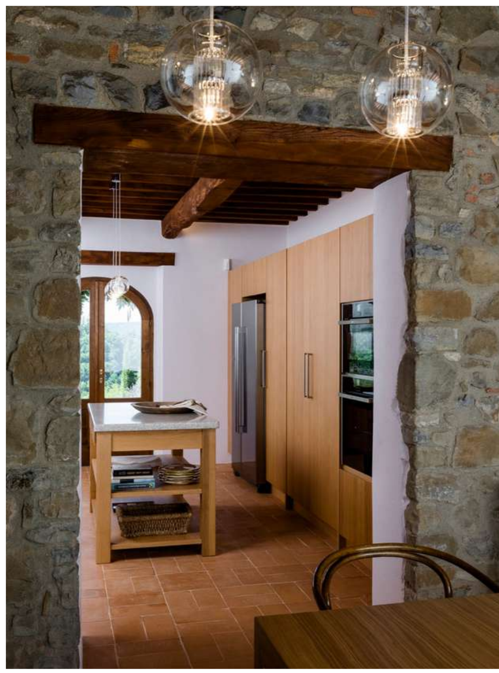
Gaiole in Chianti