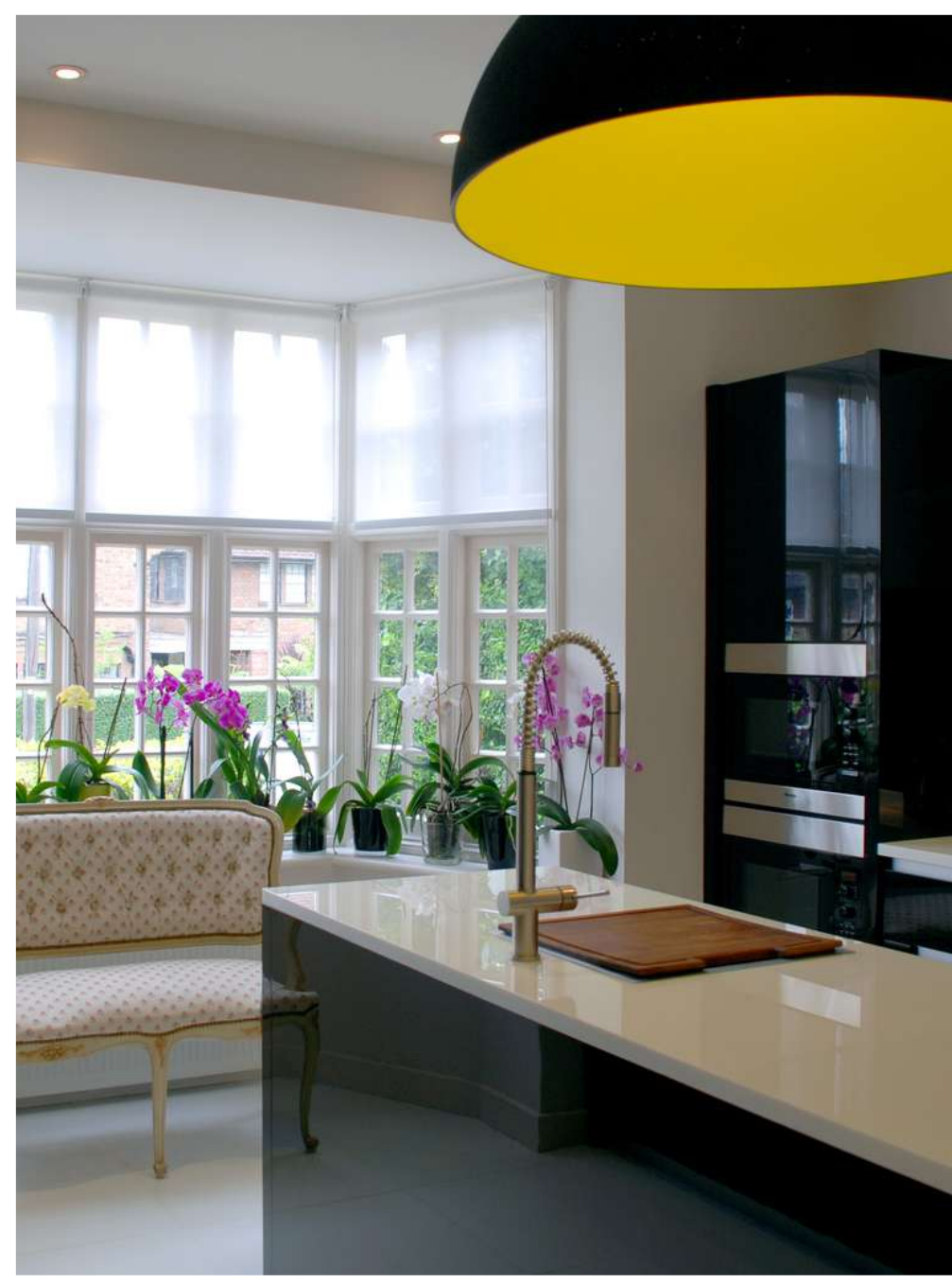
Hampstead - Londra Schneider Designers