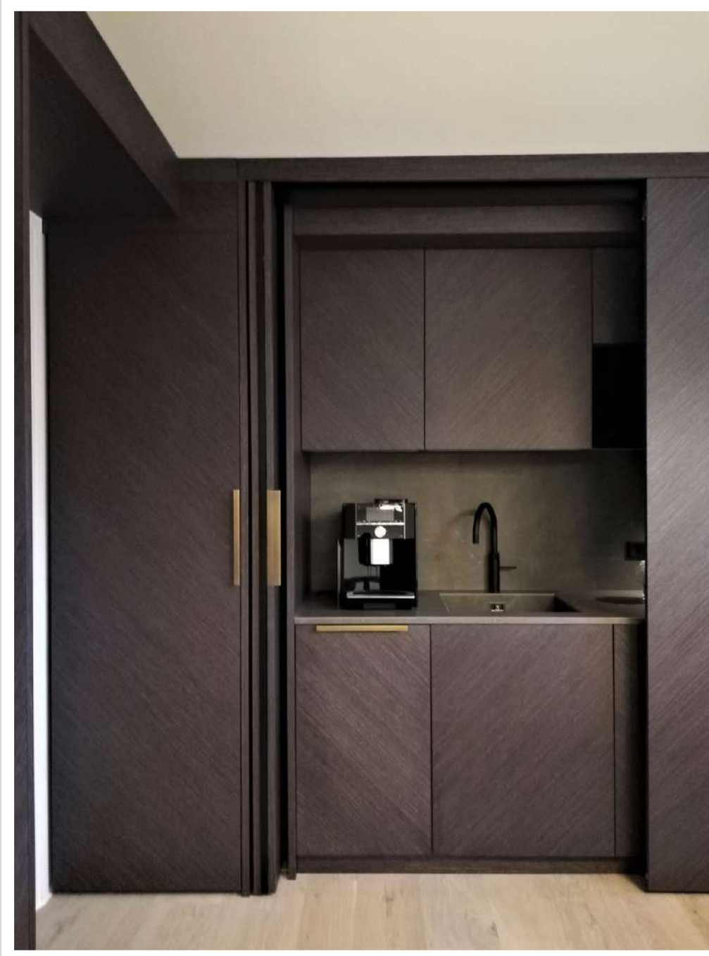
Copenhagen Architetto Fantacci