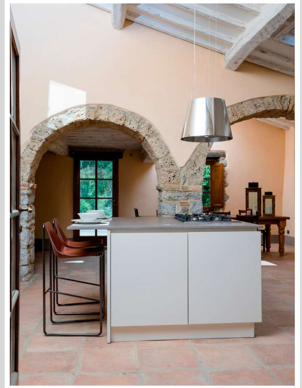
Castellina in Chianti